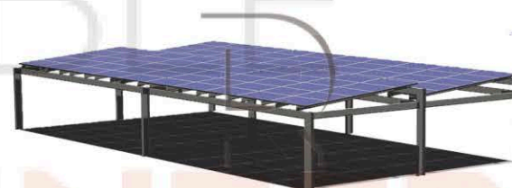
Structure modulaire pour toitures