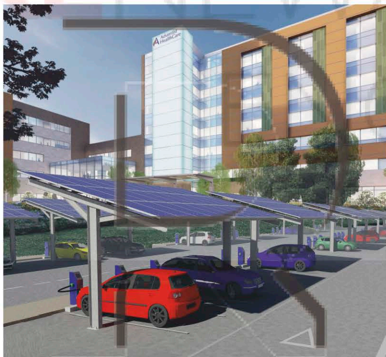
Parking avec auvent simple