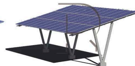
Auvent avec double pilier